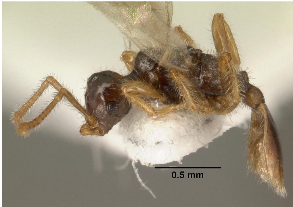
Fig. 8, Teleutomymex schneideri female, lateral view.