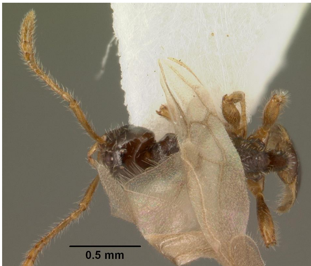
Fig. 9, Teleutomymex schneideri female, dorsal view.

Figs. 7-9: Specimen: CASENT0101582; AntWeb.