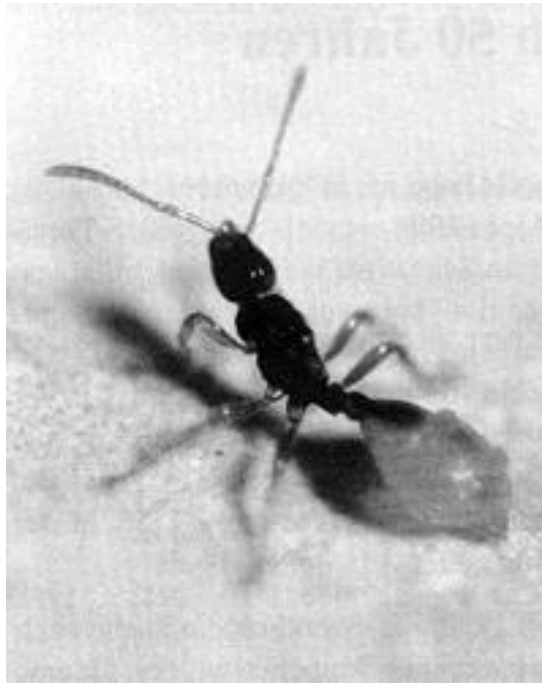
Fig. 6, Teleutomymex schneideri Königin, schwach physogaster.

Figs. 4-6: from Buschinger, A., 1995; Ameisenschutz aktuell.