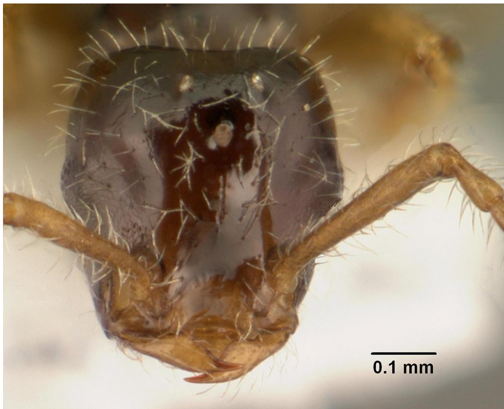
Fig. 7, Teleutomymex schneideri female, frontal view.

Figs. 4-6: from Buschinger, A., 1995; Ameisenschutz aktuell.